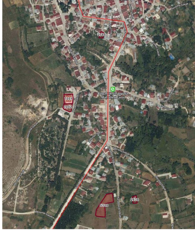
Şekil 1: Cumhuriyet ve Sinanpaşa mahallerinde değişikliğe konu parseller ve Çevresine Ait Uydu Görüntüsü

Tokat ili Başçiftlik ilçesi Cumhuriyet Mahallesi 7001,7002,2788 parseller ile Sinanpaşa mahallesi 2638,5328 parsellerde imar planının uygulanmasını kolaylaştırmak adına Belediyesince imar planı değişikliği talep edilmiştir.